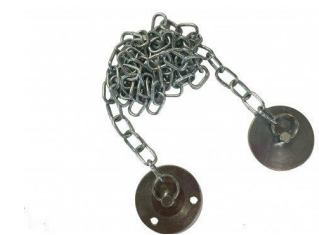
SG-771 Kjedeforlenger 1m